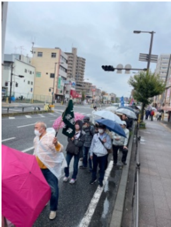
雨の中、みんなでデモ行進

メーデーは組合にとってすごく大事なイベントで、『寝屋川支部の組合員が組合費を取り戻す10の方法』にもあるように、参加していただくと動員費が出ます。来年はもっとたくさんの方の参加をお待ちしています。